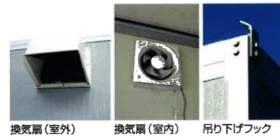
換気扇(室外) 換気扇(室内) 吊り下げフック